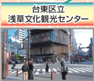
台東区立 浅草文化観光センター