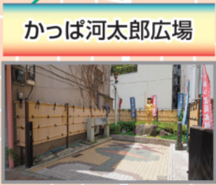
かっぱ河太郎広場