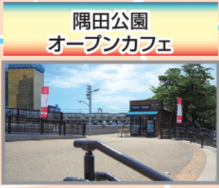
隅田公園 オープンカフェ