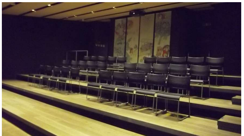
6階 多目的スペース（約100㎡、収容約100人）