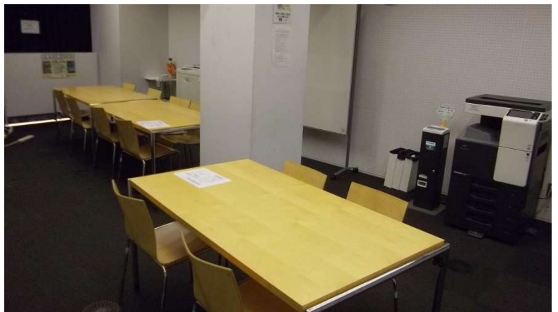
3階 旅行団体支援スペース（4人掛け＋8人掛け）