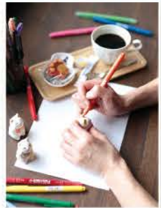
「招き猫の絵付け体験」の作品は持ち帰れます