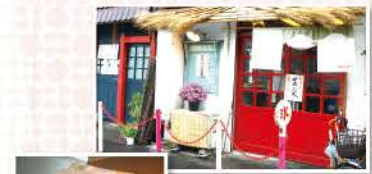
谷中銀座から路地を少し入ったところにある店

〒台東区谷中3-11-18 MAP p.3 ☎03-3824-4132(夏は出られない場合あり) 10:00頃~18:00頃 月曜(8月は無休、10~5月は火曜休、臨時休業あり)