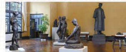
アトリエには、数々の作品を展示