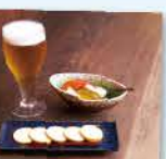
ビールのつまみは、自家製ピクルスなど