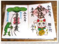
かわいい招き猫の御朱印