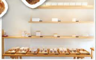
和モダンのおしゃれな店内。ギフト用に和紙と桐の箱を用意

〒台東区谷中3-12-2 ☎03-5834-8981 11:00~17:00(売り切れ次第閉店) 不定休 MAP p.3