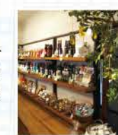
ピネガー、バルサミコも豊富で、試食できます

☎03-5834-2711 10:30~19:00 月曜(祝日の場合は営業、翌日休)