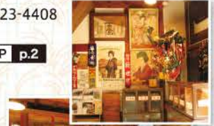
いまでも使われているかのように道具類が自然に展示

ブレんのほか、そばの実&黒ごま、黒糖キャラメル、焼きリンゴなど。土台とトッピングの味をそれぞれ変え、味の組み合わせは無限