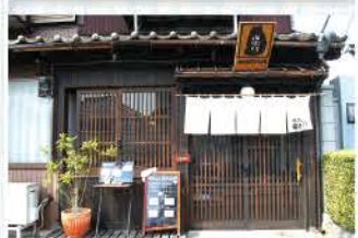
猫の町・谷中ならではのカフェ