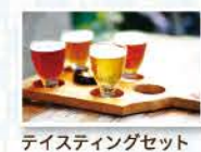
テイステイングセット