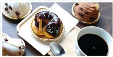
黒猫のモンブラン、白猫のレアチーズなど、猫にちなんだメニューがズラリ