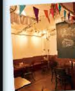
カウンター席とテーブル席がある店内