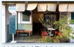
さんさき坂の中腹にあるカフェ。日替わりランチもあり