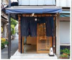
谷中銀座商店街にある、和テイストの店