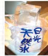
日光の自然の中でじっくり時間をかけて作られる天然氷