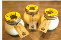
谷中プリンを持ち帰りOK