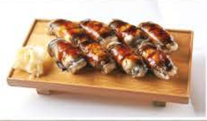
ネタを贅沢に使った穴子寿司。ふっくらと煮上げた穴子が口の中で溶けていきます

お食事をされた方に、碗物を1杯プレゼント(内容はおまかせ。1グループ4名まで)。平日夜のみ。2019年7月末日まで有効。