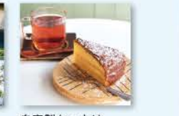
自家製ケーキは、夜もオーダー可能