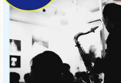
ジャズのライブをはじめ、トークライブ、絵画展などさまざまなイベントが行なわれています