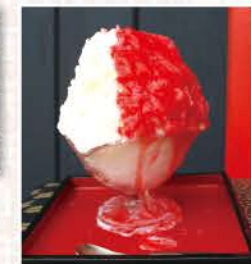
写真は「ひみつのいちごみるく」。夏は柑橘三昧やミルクイ甘夏などがさわやか!