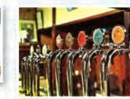
個性豊かなビールを飲み比べ!