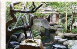
池に巨石が配された回遊式庭園