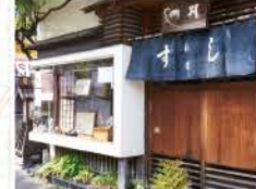
半世紀以上、寺町・谷中で親しまれている名店