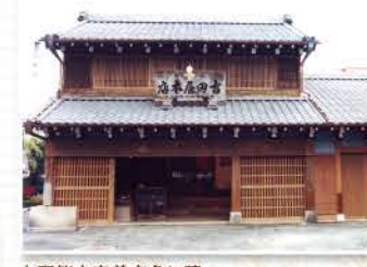
上野桜木交差点角に建つ

〒台東区上野桜木2-10-6 ☎03-3823-4408 9:30~16:30 月曜、年末年始 入館無料 MAP p.2