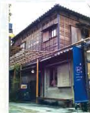
昭和のノスタルジックな空間が広がります