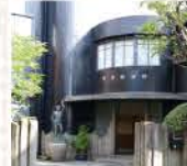
朝倉氏が自ら設計したアトリエ兼住居