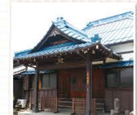
慶安3年(1650)創建といわれる由緒ある寺。本堂を参拝してから寺務所で受付を。