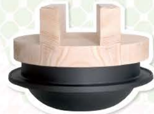
オリジナルの「釜浅のごはん釜」。鉄がごはんの味をおいしく!