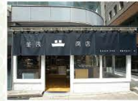
道具街の中程にあり、店頭のものが目印