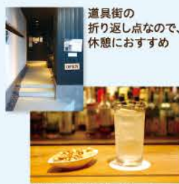
道具街の折り返し点なので、休憩におすすめ

本誌提示で、合計金額から10%割引。(パーティタイムのみ、1回限り、2019年10月末日まで有効)