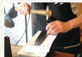
包丁を購入すると、名前などの文字を彫ってくれる