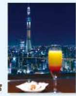
東京スカイツリーを見ながら飲める特等席