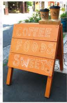
かっぱ橋本通り沿いの看板が目印