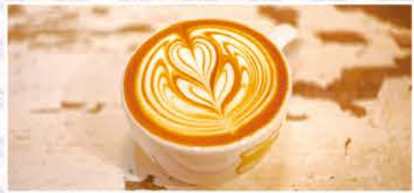
見事なラテアートは、飲むのがもったいない!

本誌提示で、コーヒーのサイズアップ無料(1冊につき1名1回限り)。2019年10月末日まで有効。