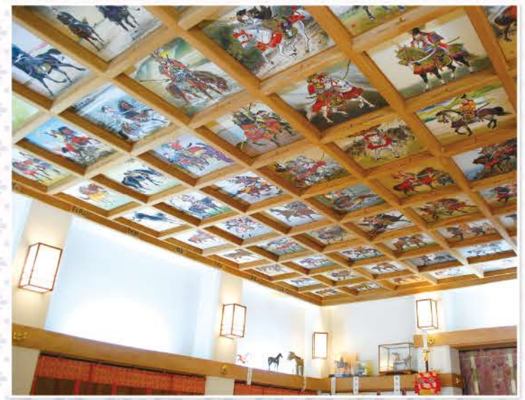
拝殿の格天井に描かれた百枚の馬乗絵