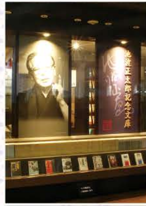
貴重な資料を展示