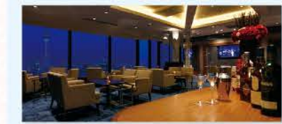
窓際のテーブル席からの景色は圧巻! ※別途チャージが必要