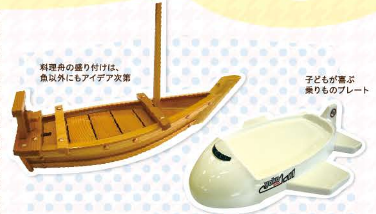
料理舟の盛り付けは、魚以外にもアイデア次第