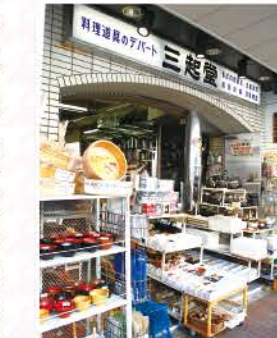
店内には、調理道具や食器がズラリ

〒台東区松が谷2-13-12 ☎03-3841-2013 ☎9:00~18:00(日曜、祝日 12:00~) 無休 MAP p.3