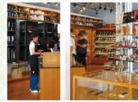
1階は包丁、2階は鍋などの調理道具フロア