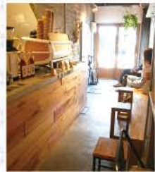
日本に数台しかないエスプレッソマシンがある、かわいい店内