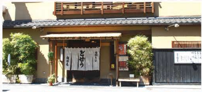
かっぱ橋通りに構える、和の風情漂う店