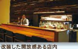
倉庫を改装した開放感ある店内