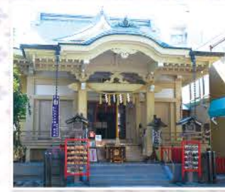
稲荷大明神が祀られる神社