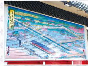
三十三間堂が建てられた当時に描かれた神楽殿