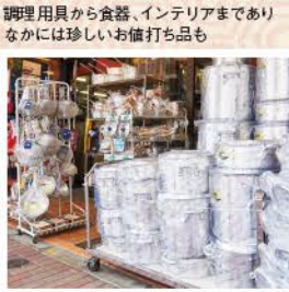
調理用具から食器、インテリアまでありなかに珍しいお徳打ち品も

プロの料理人御用達の調理道具店がズラリ! かつぱ橋道具街® 約800mにわたって通りの両側にプロ用の調理道具店が並び、歴史ある商店街。一般客でも買える店が多く、観光客にも人気です。特に最近では食品サンプルグッズが大人気。 台東区西浅草、松が谷 MAP 裏表紙 C-3 ☎03-3844-1225 (東京合羽橋商店街振興組合)