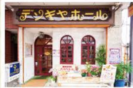
元電気屋さんだったことからこの店名に

特典 オム巻きとゆであずきの注文で1,150円のところ1,000円 (先着5名様)