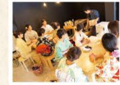
体験教室は1時間半~2時間