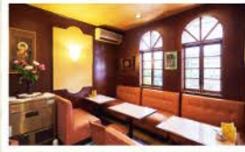
店内奥では、昭和のゲーム機で遊べます