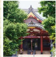
優美な本殿には浅草名所七福神の毘沙門天も鎮座