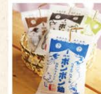
懐かしいボンボン飴も販売