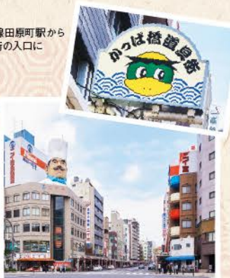
東京メトロ浅草線田原町駅から徒歩5分で道具街の入口に

プロの料理人御用達の調理道具店がズラリ! かつぱ橋道具街® 約800mにわたって通りの両側にプロ用の調理道具店が並び、歴史ある商店街。一般客でも買える店が多く、観光客にも人気です。特に最近では食品サンプルグッズが大人気。 台東区西浅草、松が谷 MAP 裏表紙 C-3 ☎03-3844-1225 (東京合羽橋商店街振興組合)