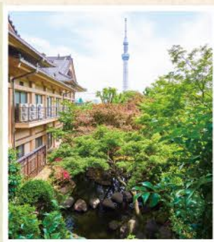
日本庭園を散策できます