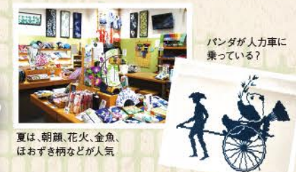
パンダが人力車に乗っている?