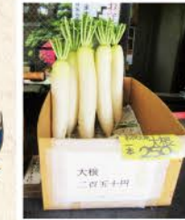
供える大根は境内でも売っています