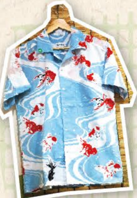
手ぬぐいのアロハシャツは、柄とサイズを選んでセミアオーダーが可能