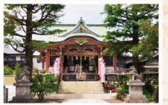
浅草名所七福神の福祿寿を祀る