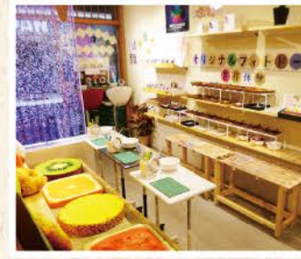
体験は随時受け付けています

特典 商品をお買い上げで、オリジナル路線マップでめぐり (先着5名様) ご来店で、招き猫オリジナル帳付 (先着50名様)