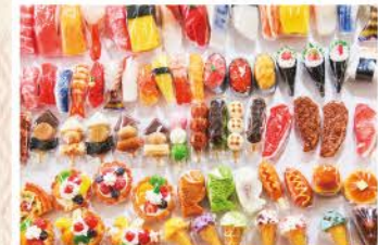
人気の食品サンプルがマグネットやキーホルダーに