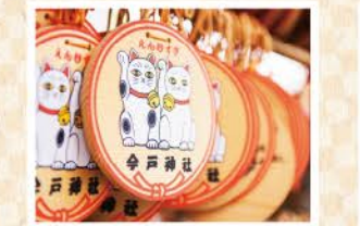
絵馬もかわいいペアの招き猫

招き猫発祥の地といわれる縁結びの神様いまだじんじや今戸神社 夫婦の神様が祀られていることから、縁結びの神社として有名です。また、招き猫の発祥の地ともいわれ、拝殿の中からビッグサイズのペアの招き猫がお出迎え。 台東区今戸1-5-22 ☎03-3872-2703 MAP 裏表紙 E-2