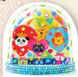
江戸風味満載の優美なスノードーム