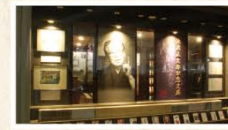
時代小説ファンにうれしい貴重な資料を展示

〒台東区西浅草3-25-16 台東区立中央図書館内 ☎03-5246-5915 ☎9:00~20:00(日・祝日は~17:00) 休第3木曜(祝日の場合は翌日) MAP 裏表紙 C-3