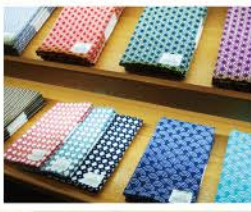
青海波、麻の葉、釘抜きなどの伝統柄