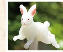
かわいいウサギの飴が作れます