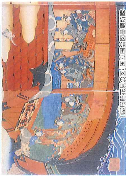
「屋形船花見の図」

屋形船のルーツをたどると、その原型は平安時代に見出すことができます。古くは万葉集にも詠まれていたというのが宮人の「舟遊び」。これが平安時代には、川や池泉に船を浮かべ、遊覧を兼ねた、という記録が残されています。江戸期に入り、幕府が訪れると、豪商や有力大名などが自前の船で盛んに遊覧をするようになります。この時期、屋形船は武家のみが使用で、一般の庶民は乗船できませんでした。そこで粋な江戸っ子は、屋形船と称する小船を浮かべ遊覧を楽しむようになりました。屋形船は、舟の上に小さな部屋が一つ乗っけているような形（櫓）で舟を操ったそうです。