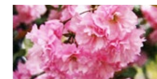
関山 (かんざん) Kanzan 遅

皇太子妃雅子様にあやかり、埼玉県鳩ヶ谷市の生産者が当初プリンセス雅として売り出しました。