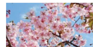
河津桜 (かわづざくら) Kawazuzakura 早

オオシマザクラ系とカンヒザクラ系の自然交配種と推測されます。花はピンクの強い一重です。