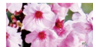
陽光 (ようこう) Youkou 早

アマギヨシノとカンヒザクラを交配して作った品種です。花茎は約4.5cmで花色は淡紅紫色です。