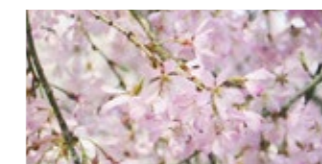
紅枝垂 (べにしだれ) Benishidare

オオシマザクラ系とカンヒザクラ系の自然交配種と推測されます。花はピンクの強い一重です。