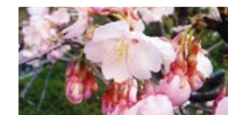
大寒桜 (おおかんざくら) Ookanzakura 早

エドヒガンとオオシマザクラの雑種で、江戸末期に江戸染井村(現在の東京都豊島区)の植木屋が、「吉野桜」の名前で売り出したと言われます。居ながらにして吉野山のサクラが楽しめるという瞬間に人気を得て、東京を中心に広く日本中に植えられました。春には旺盛なサクラの景色を楽しませてくれます。