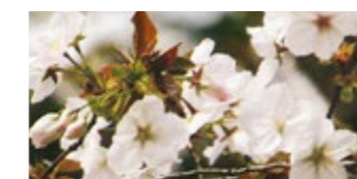
太白 (たいはく) Taihaku

中国南部や台湾に分布する桜です。花柄は下垂し花茎2cmばかりの半開状の暗紅色あるいは桃紅色の花をつけます。