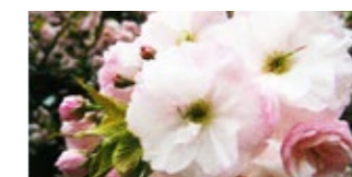
一葉 (いちよう) Ichiyou 遅

花期は春とされていますが、日本では環境条件によるものが、春と秋(9~10月)の二季咲きです。