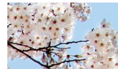
染井吉野 (そめいよしの) Someiyoshino

エドヒガンとオオシマザクラの雑種で、江戸末期に江戸染井村(現在の東京都豊島区)の植木屋が、「吉野桜」の名前で売り出したと言われます。居ながらにして吉野山のサクラが楽しめるという瞬間に人気を得て、東京を中心に広く日本中に植えられました。春には旺盛なサクラの景色を楽しませてくれます。