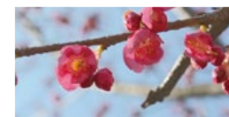
寒緋桜 (かんひざくら) Kanhizakura 早

中国南部や台湾に分布する桜です。花柄は下垂し花茎2cmばかりの半開状の暗紅色あるいは桃紅色の花をつけます。